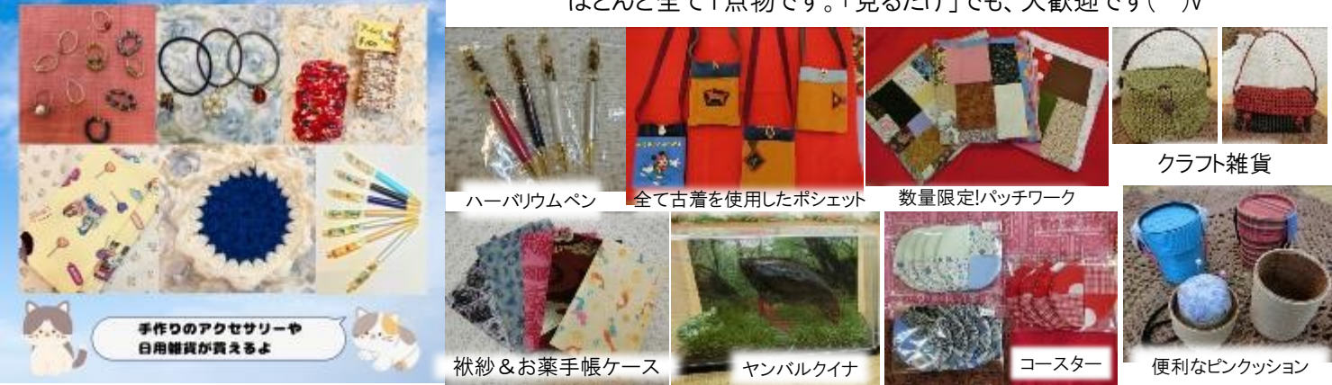
手作りのアクセサリーや日用雑貨が買えるよ