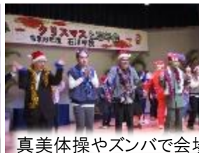
真美体操やズンバで会場を盛り上げました♪