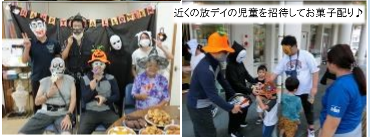
近くの放デイの児童を招待してお菓子配り♪