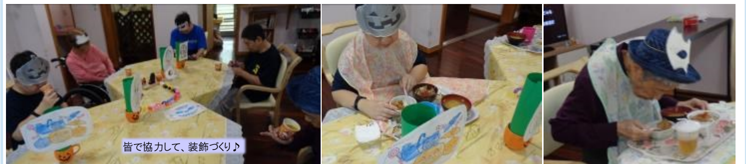
皆で協力して、装飾づくり♪