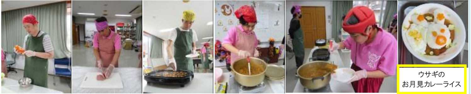
ウサギのお月見カレーライス

9月といえば、十五夜！ということで、9月の調理実習は季節感を味わってもらおうと十五夜お月見カレーを作りました。『具材の皮むき、炒める、煮込む』工程を、皆さん大好きなカレーということもあり、張り切って取り組んでいました。うさぎ型の白米の周りにカレーをかけ、見た目も楽しめる！美味しい十五夜お月見カレーが完成しました。食べるのがもったいない…と思いましたが、あっという間に完食していました♪ (生活支援員:平良 麻香)