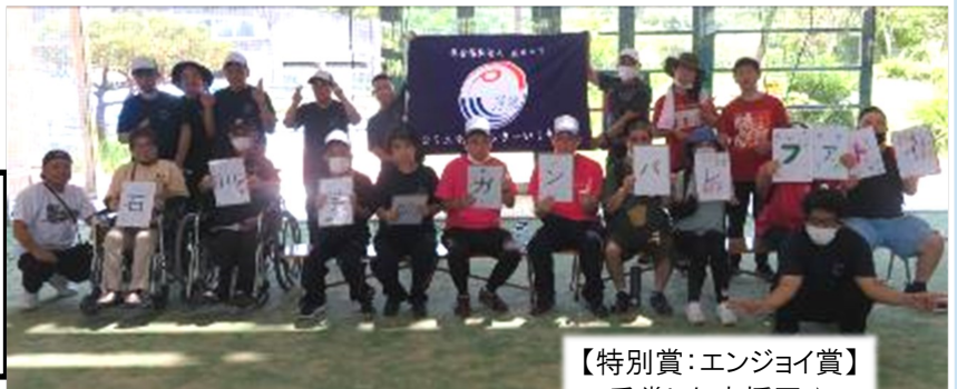
【特別賞:エンジョイ賞】 受賞した応援団♪