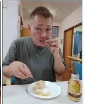
新しい仲間と♪新生活スタート♪