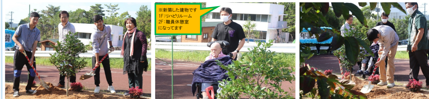
※新築した建物です 1F:リハビリルーム 2F:職員休憩室 になっています