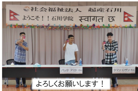
よろしくお願いします！