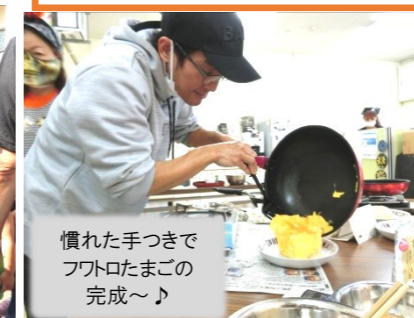
慣れた手つきでフワトロたまごの完成～♪