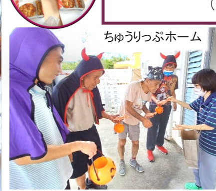
ちゅうりっぷホーム