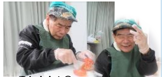
我如古さん😊 包丁使って野菜のカット！ 楽しくてピースサイン♪