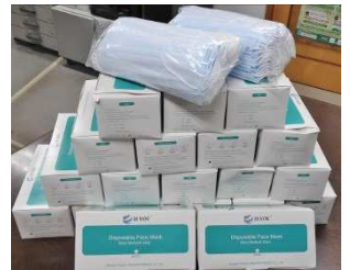
保護者会より頂きました。

保護者会やうるま市等たくさんの方よりマスクの寄贈を頂きました。これからも新型コロナウイルスとの戦いは続きますが、頂いたマスク等も活用し、法人にコロナウイルスを持ち込まないよう、取り組んでいきます。誠に有難うございました。(起産石川職員一同)